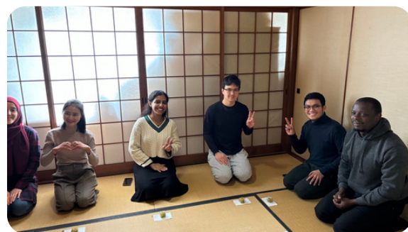
茶道ワークショップ - Sado Workshop